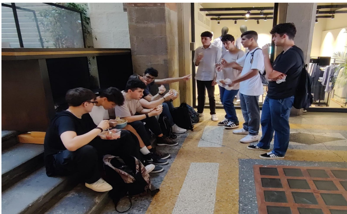
Studenti in pausa pranzo a Bologna prima della presentazione del pitch

Attestato relativo al Premio Speciale per qualità manageriali del Team