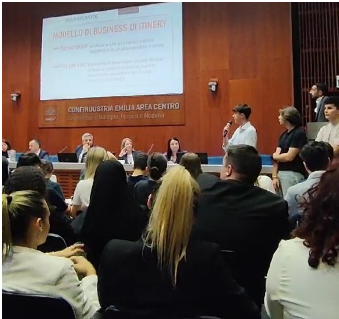
Momento dell'esposizione del pitch presso la sede di Confindustria Emilia Centro a Bologna.